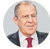
СЕРГЕЙ ЛАВРОВ, МИНИСТР ИНОСТРАННЫХ ДЕЛ

“ Россия не ставит политику выше экономики — мы пока еще помним учение Маркса