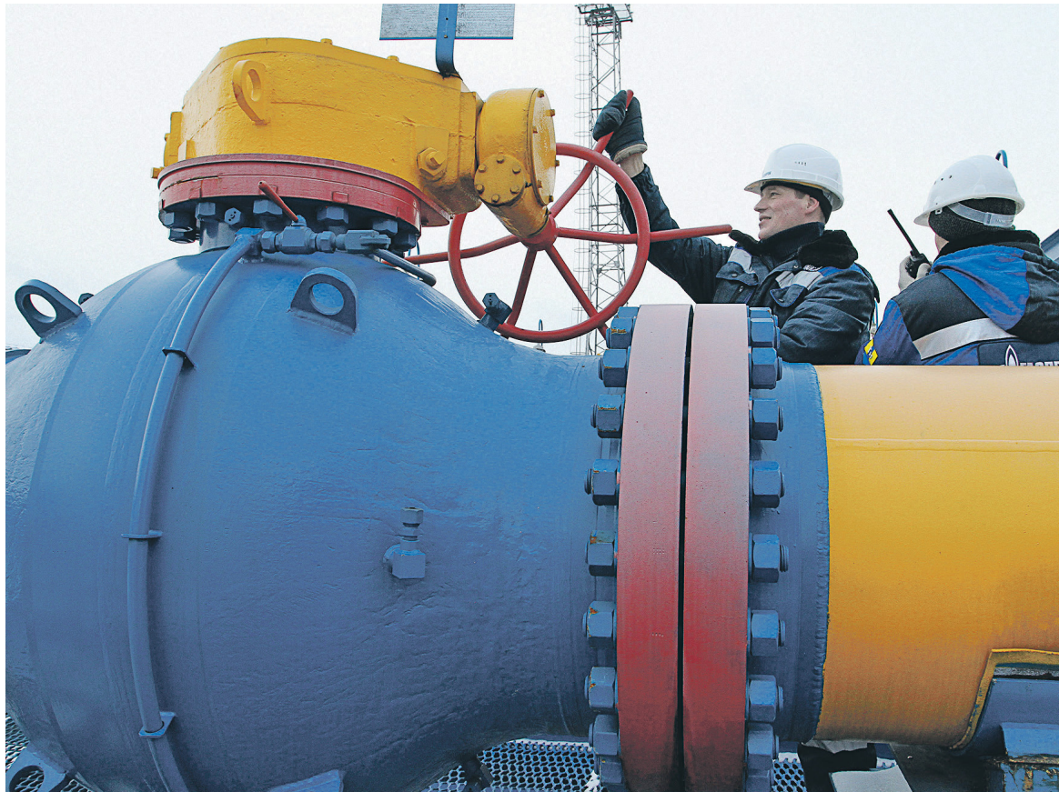
В случае прекращения транзита газа «Газпрома» через Украину наибольшему риску подвергнутся экономики балканских стран, Болгарии и Венгрии, полагает эксперт

Еврокомиссия призвала все вовлеченные в спор стороны, компании и профильных министров