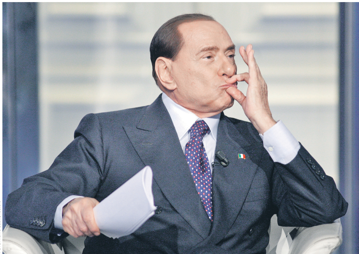
По словам экспертов, Сильвио Берлускони хочет оставаться в политике, но пока не претендует на кресло премьера, рассматривая себя скорее «тренером» или «серым кардиналом»

По тогдашнему избирательному законодательству коалиция, собравшая наибольшее число голосов, автоматически получала 340 мест из 630 в нижней палате (54%). Демократы получили большинство мандатов и сформировали правительство во главе с Энрико Леттой, которое не проработало и года: из-за противостояния внутри Демпартии политик уступил пост лидера партии и премьер-мэру Флоренции Маттео Ренци. В декабре 2016 года по инициативе