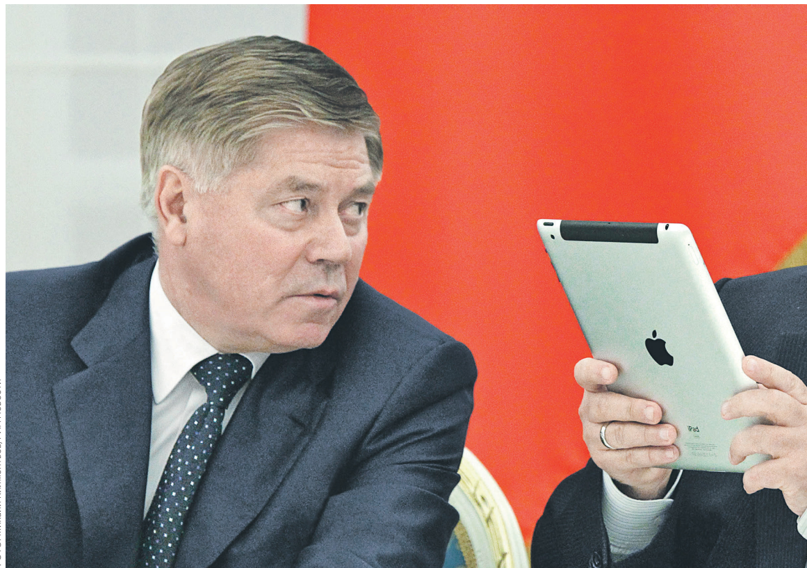
Верховному суду (на фото: председатель Вячеслав Лебедев) предстоит вынести решение, которое может стать определяющим для статуса криптовалют в России, полагает юрист

Решение о блокировке Bitcoininfo.ru было вынесено Выборгским районным судом Санкт-Петербурга в июле 2016 года (копия решения есть у РБК). Размещенная на