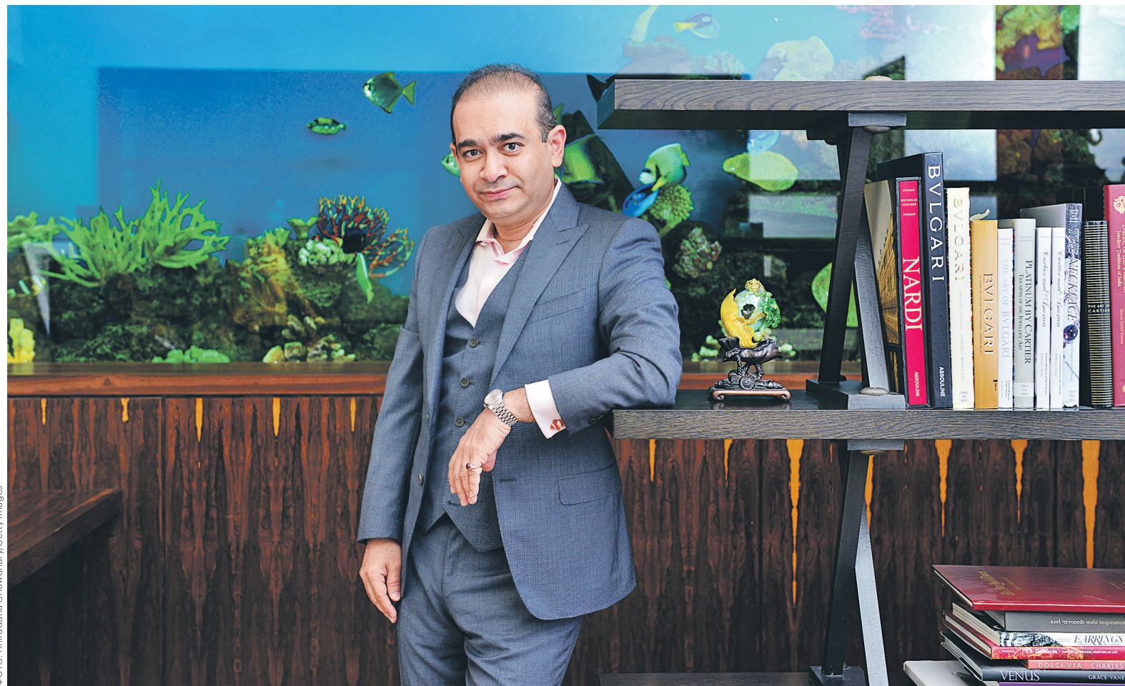
Нирав Моди, как выяснилось, покинул Индию вместе с семьей еще в январе, а Центральное бюро расследований обратилось в Интерпол с просьбой помочь установить его местонахождение

Устроившись в компанию Gitanjali, которая принадлежала