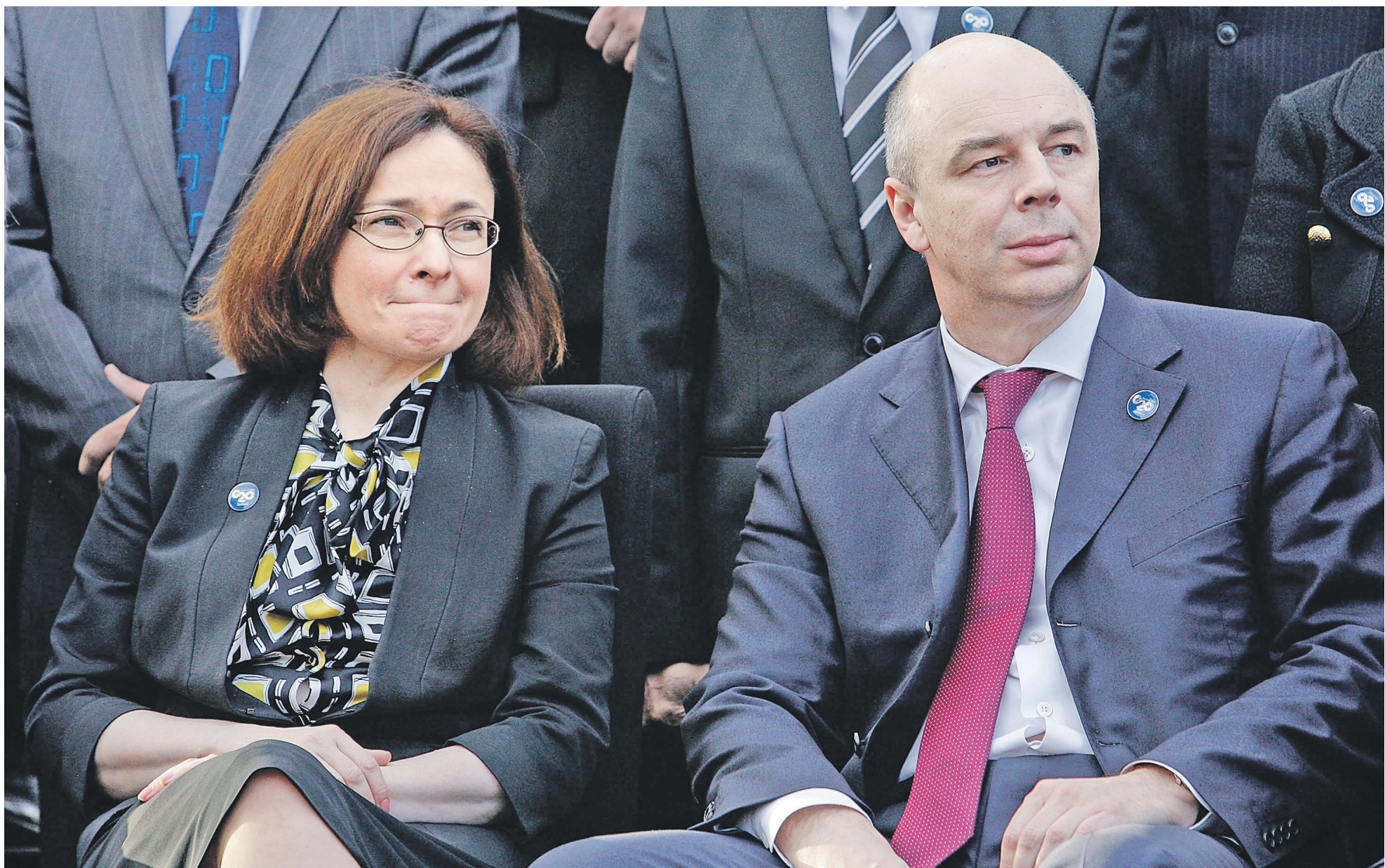
Центробанк и Минфин представили новые предложения по модернизации системы пенсионных накоплений. На фото: глава Минфина Антон Силуанов и глава ЦБ Эльвира Набиуллина

ИННОВАЦИЯ Граждане узнают о подключении к пенсионной системе из трудового договора