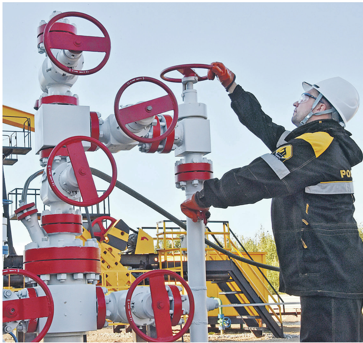
Вопрос о продлении соглашения с ОПЕК о сокращении добычи нефти будет обсуждаться его участниками 25 мая на встрече в Вене

В качестве компенсации потерь от сокращения добычи нефти отрасль могла бы просить у государства расширения эксперимента по налогу на добавленный доход (НДД) на обводненные месторождения и отказа от налога на добычу полезных ископаемых (НДПИ), считают аналитики. Но Минэнерго уже отказало в этом: как заявил журналистам в минувший вторник министр энергетики Александр Новак, ведомство не планирует компенсаций для российских компаний в связи с возможным продлением соглашения по сокращению добычи нефти. При этом правительство в апреле одобрило налоговую реформу в нефтяной отрасли и согласилось