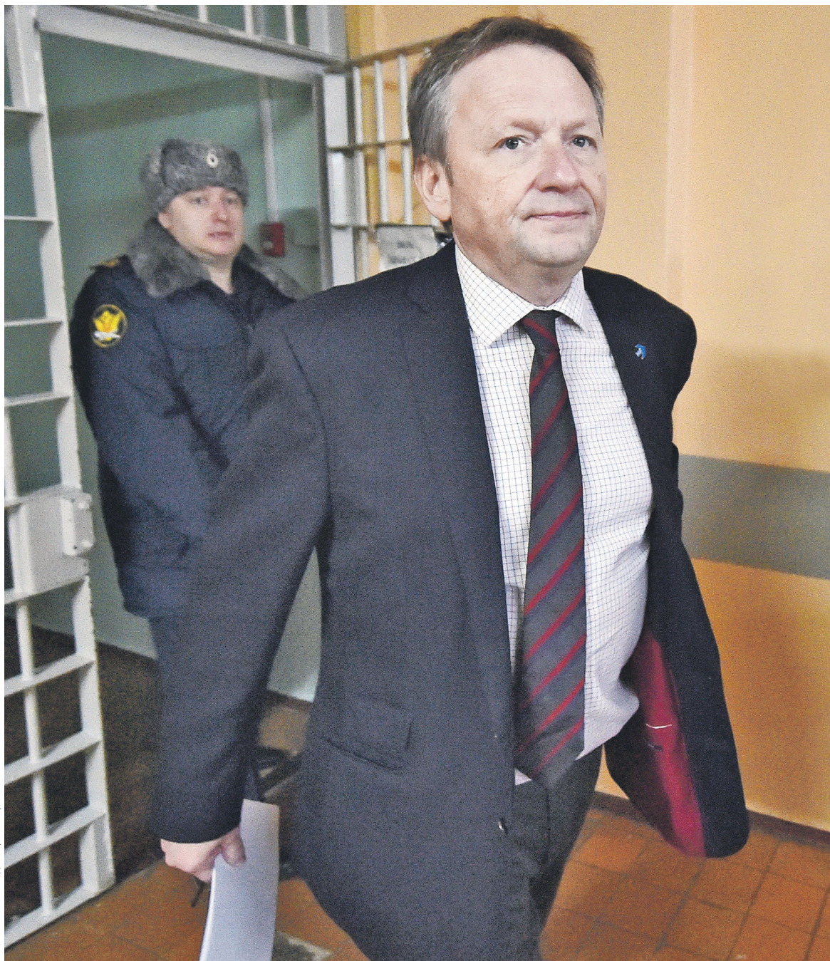
Бизнес-омбудсмен Борис Титов (на фото) предлагает, чтобы суд первой инстанции мог решать вопрос о мере пресечения для подозреваемого только два раза на два месяца. В следующий раз продлить ее сможет только суд вышестоящей инстанции