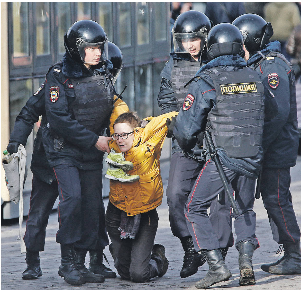
Эксперты и участники антикоррупционных митингов, прошедших 26 марта, отмечали, что среди протестующих было много подростков

По первому сценарию, представители поколений Y (родились в 1980-е и 1990-е годы) и Z (поколение 2000-х) ищут контакты со старшими, и это дает обоим поколениям возможность договориться, отметил президент «Петербургской политики» Михаил Виноградов. Если этот «романтический» сценарий осуществится,