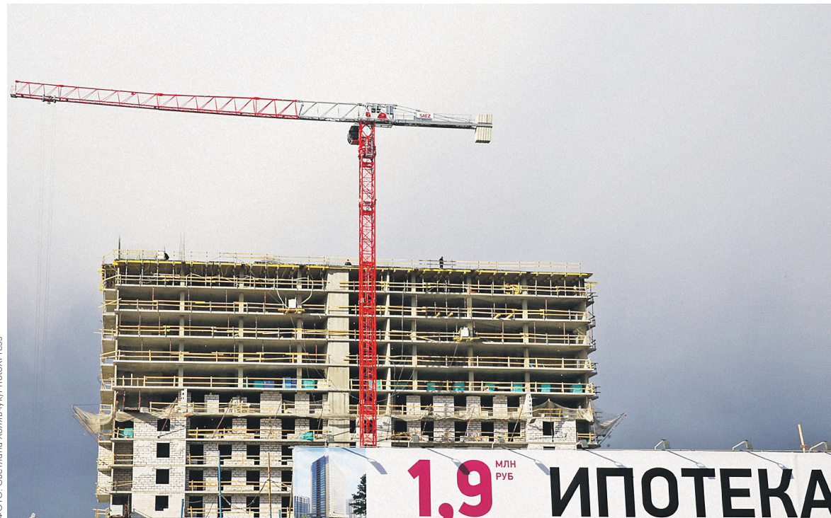
Сбербанк стремится переманить у крупнейших игроков финансового рынка наиболее качественных заемщиков, полагает эксперт

В вопросе рефинансирования Сбербанк — не первопроходец. Более того, на этот рынок он вышел одним из последних из крупных банков. В настоящее время программы рефинансирования ипотеки и других видов кредитов есть как минимум у топ-6 российских банков по объему ипотечного портфеля: ВТБ, Россельхозбанк, Газпромбанк, Райффайзенбанк, Абсолютбанк, «Открытие».