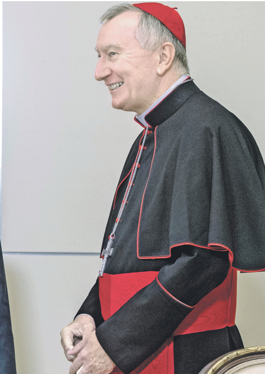
Кардинал Пьетро Паролин (справа) на встрече с Владимиром Путиным сказал, что видит «новую динамику, которая появилась в последние годы, месяцы»

хата и Украинской греко-католической церковью (униаты, признают юрисдикцию папы римского. — РБК). Представители униатов критикуют патриарха Кирилла за его солидарность с политикой Кремля на Украине, указывает эксперт.