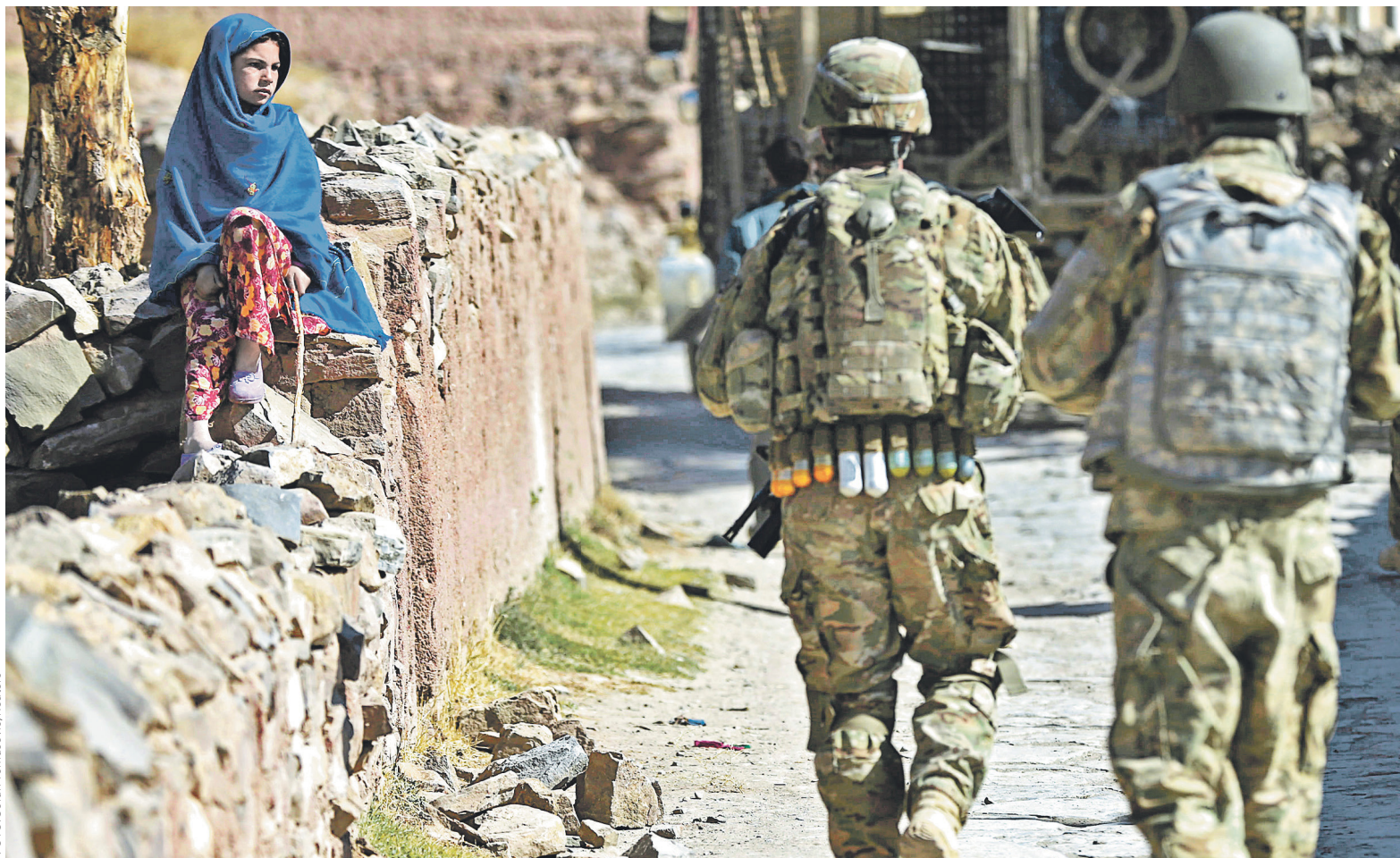
Пик военного присутствия США в Афганистане пришелся на 2011 год: в это время там находились около 100 тыс. американских военнослужащих

Трамп пообещал увеличить военное присутствие в Афганистане и призвал последовать этому примеру партнеров по НАТО. Насколь-