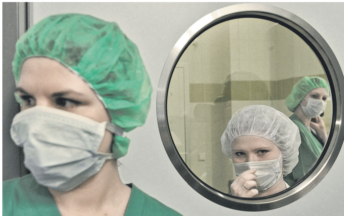
Действующая в России система учета социальной поддержки населения, по мнению экспертов НИФИ, не позволяет оценивать эффективность принимаемых мер

В России меры господдержки и так носят адресный характер, сообщила РБК пресс-служба Минтруда: она «осуществляется в отношении конкретного гражданина, чьи персональные данные находятся в распоряжении органов социальной защиты». Исходить нужно из критериев нуждаемости, и на федеральном уровне они уже применяются в отношении выплаты пособия при рождении третьего и последующего ребенка (при расчете выплаты используется среднеду-