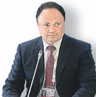
Игорь Пушкарев, мэр Владивостока