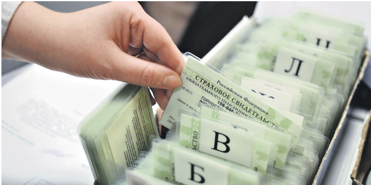
Рост объемов пенсионных накоплений в НПФ на руку в первую очередь самим будущим пенсионерам, считает эксперт