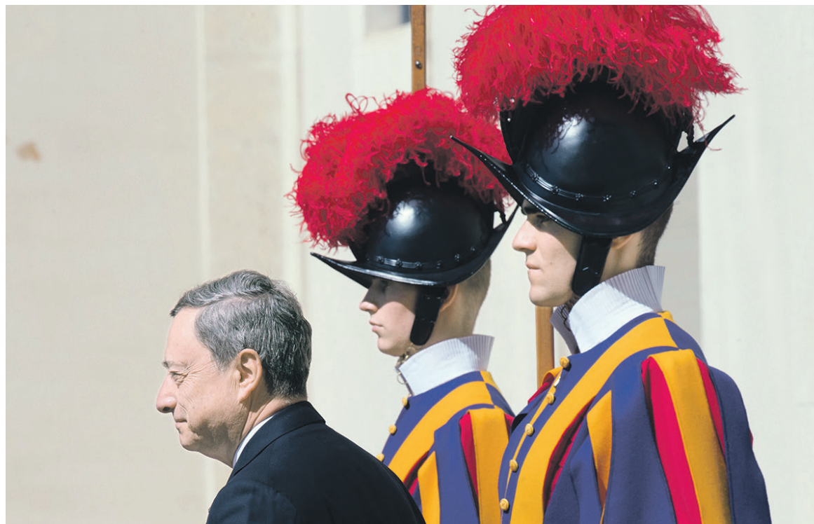
Позитивная оценка состояния экономики ЕС со стороны главы ЕЦБ Марио Драги может укрепить евро и ослабить рубль

В своем обзоре «Глобальный и российский валютный рынок. Впереди важные дни» Том Левинсон называет четыре существенных фактора, которые могут повлиять на курс российской валюты. В частности, в четверг, 2 июня, пройдет заседание ЕЦБ, на котором будут рассматриваться текущие процентные ставки и программа стимулирования европейской экономики. Аналитик не ожидает каких-то изменений в монетарной политике европейского регулятора, но считает, что позитивная оценка состояния экономики ЕС со стороны главы ЕЦБ Марио Драги может укрепить евро. «Инвесторам не следует недооценивать способность ЕЦБ