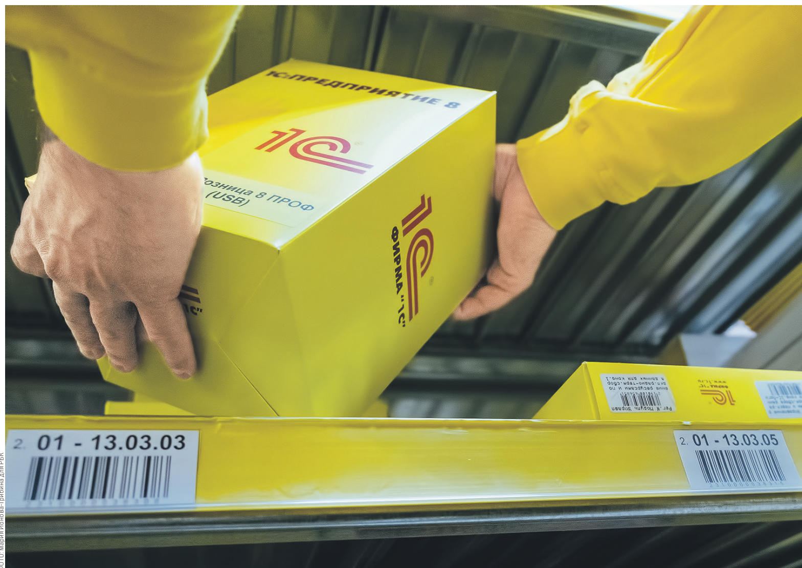
«1С» оказалась самой популярной франшизой прошлого года — компания заключила 748 договоров коммерческой концессии

«Мы занимаем довольно большую часть рынка, и конкуренция здесь как соль в супе: чтобы суп был съедобный, ее должно быть не слишком много и не слишком мало»