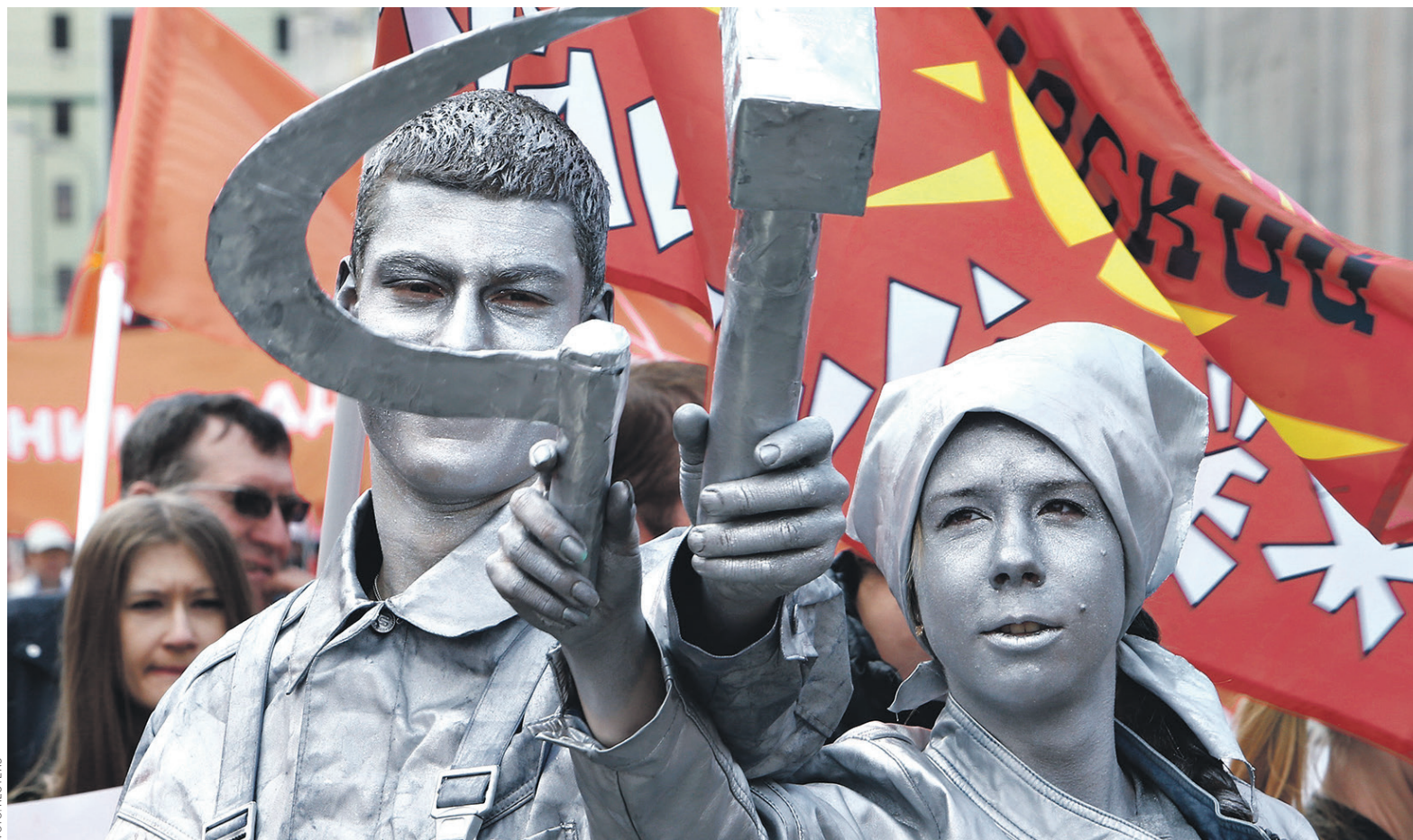
Десятки НПФ обгоняют инфляцию и показывают результаты лучше, чем у ВЭБа