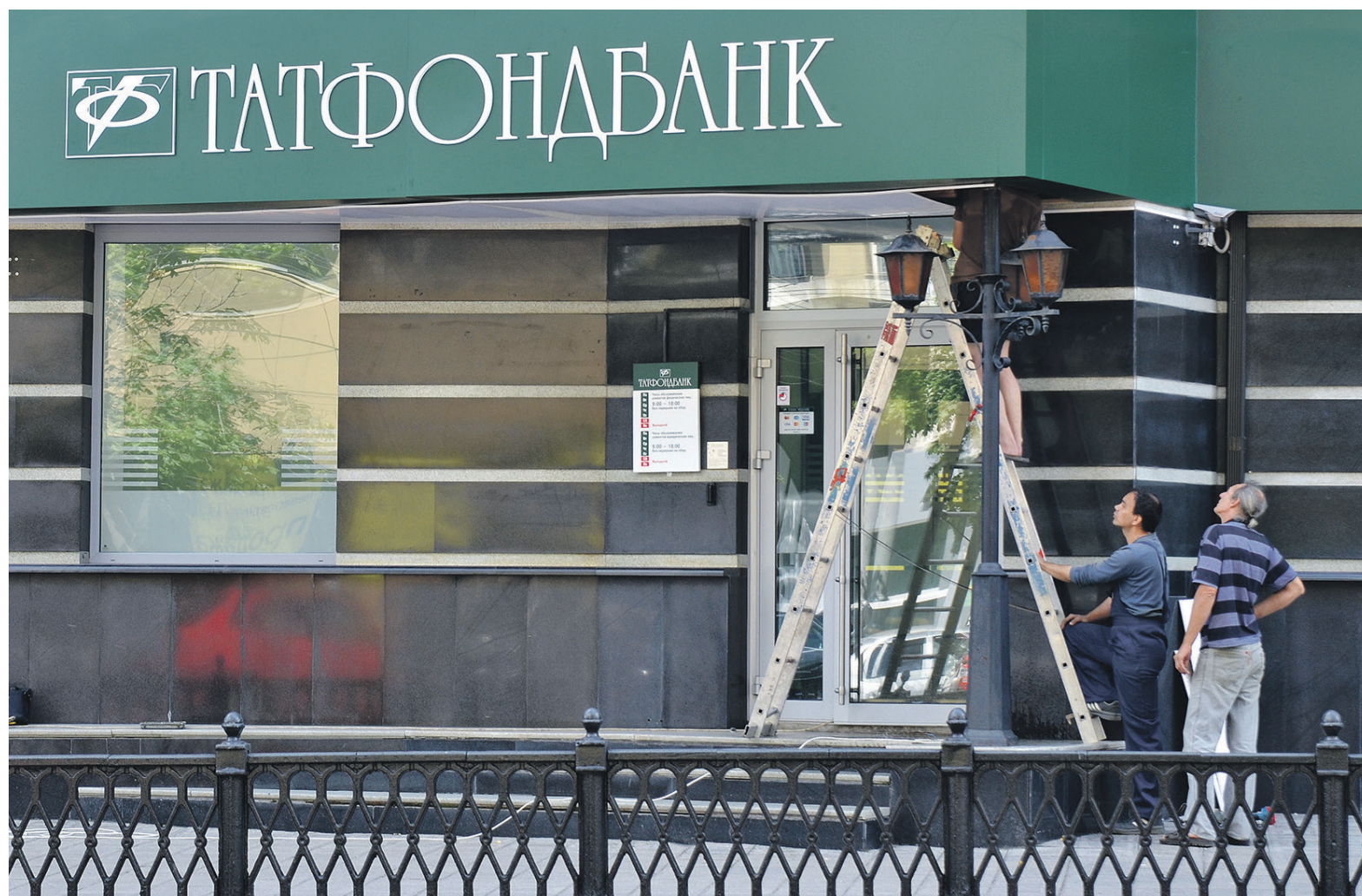
Основной акционер, правительство Татарстана, поддержит Татфондбанк «по мере своих возможностей».

Согласно второму варианту, санатором Татфондбанка должна выступить крупнейшая кредитная организация региона и входящий в топ-20 российских банков по активам банк АК БАРС. Но в этом случае может возникнуть юридическая нестыковка, отмечает источник. Согласно закону о банкротстве санация предусматривает смену собственника компании-должника. Фактически такими собственниками должны стать акционеры банка АК БАРС. Однако, Республике