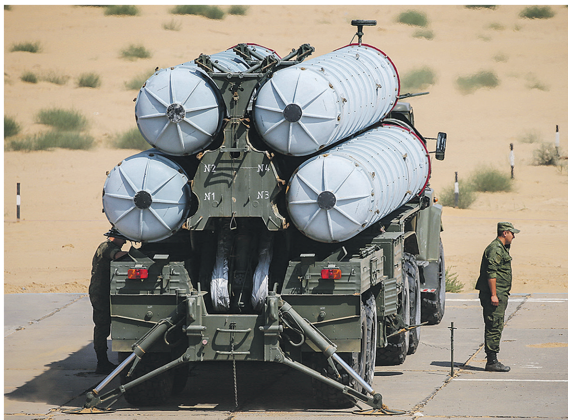
В 2007 году Москва и Тегеран подписали контракт на поставку зенитно-ракетных комплексов С-300 на сумму около $900 млн. Введенные Советом Безопасности ООН санкции в отношении Ирана остановили сделку, однако в сентябре 2016-го С-300 все же поступили заказчику

«Открытие представительства РЭЦ в Иране было связано с высоким потенциалом внешнеэ-