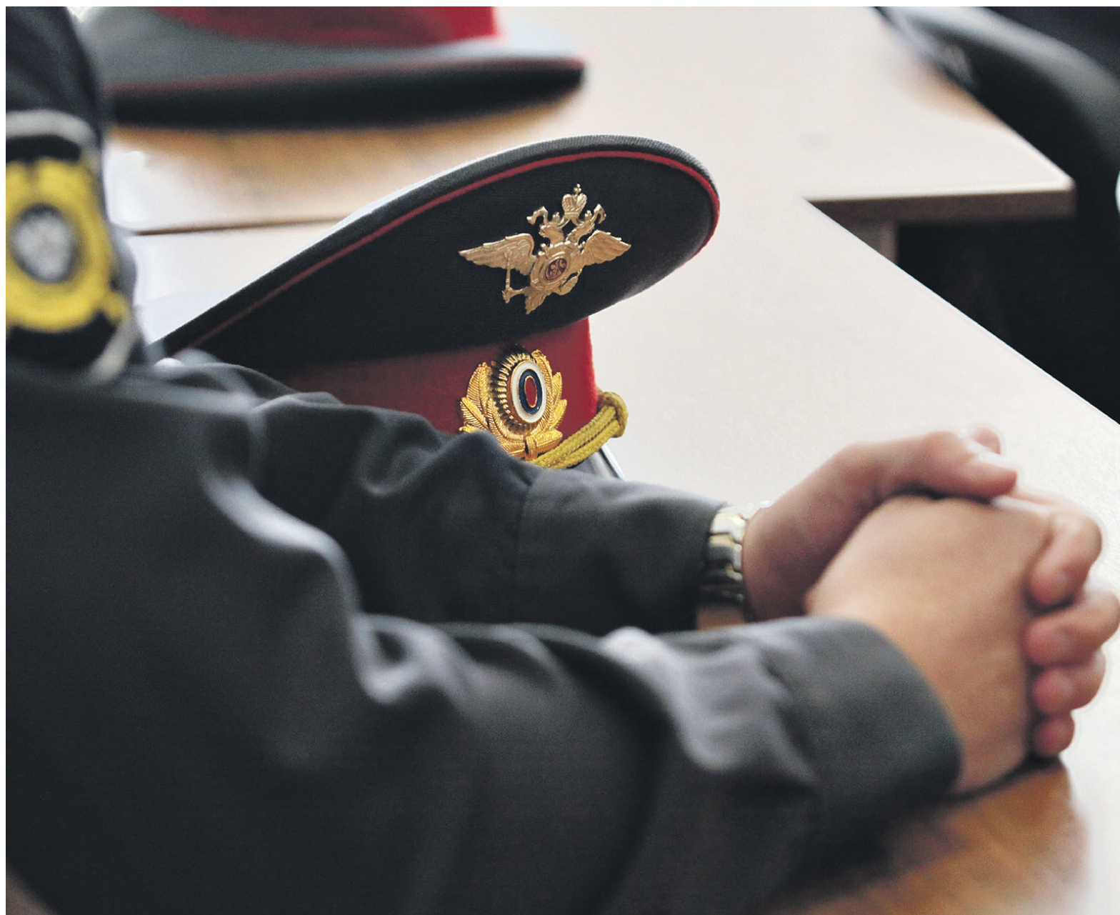
Больше всего заподозренных в фальсификациях авторов научных работ издавались в журналах «Закон и право», «Вестник Московского университета МВД» и «Вестник экономической безопасности»

«Вестник Московского университета МВД» получил регистрацию СМИ в 2003 году после объединения Московской академии МВД, Московского института МВД и Юридического института МВД. Созданный на базе этих структур, универси-