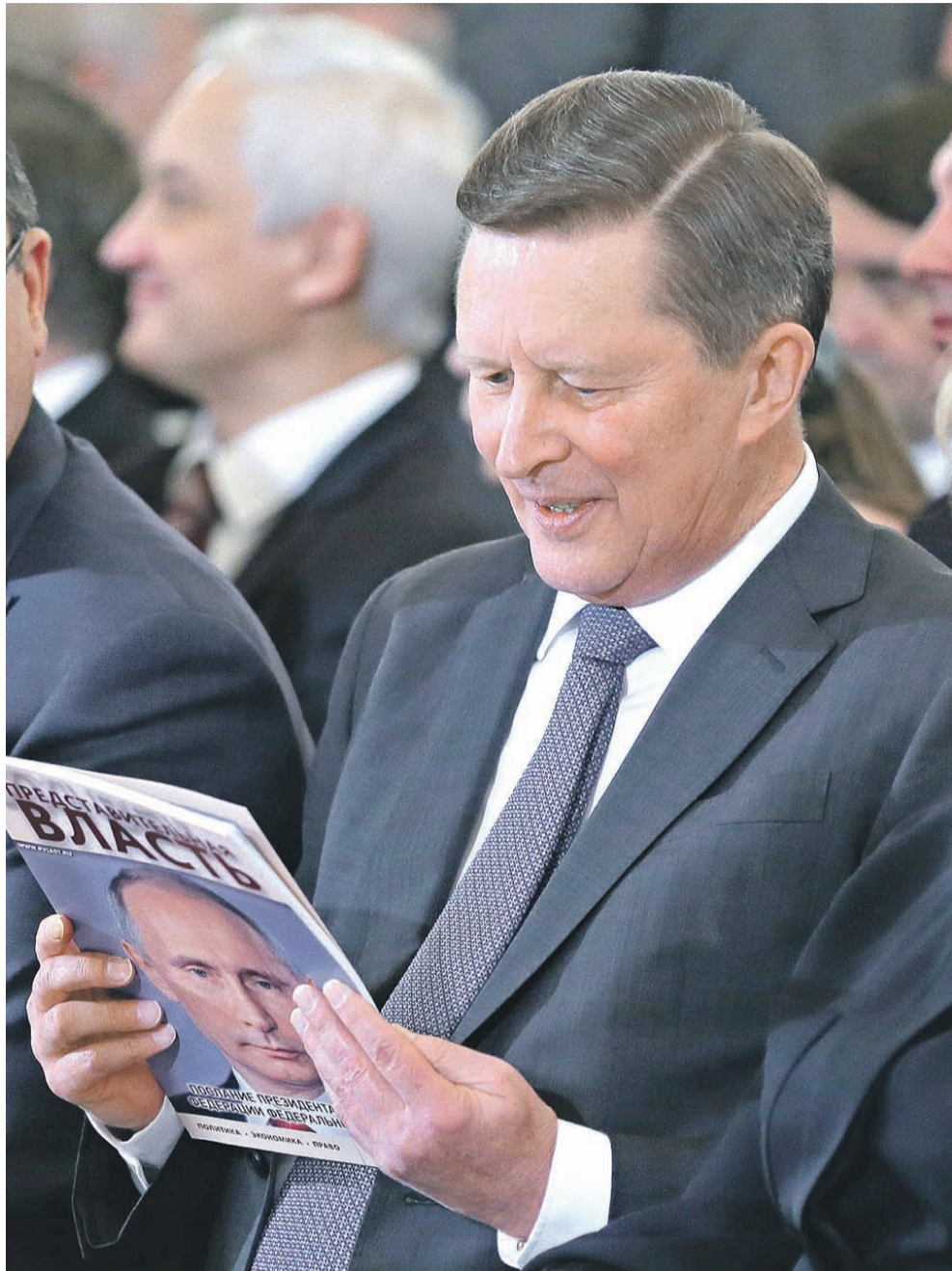
Руководитель администрации президента Сергей Иванов, похоже, не ждал от послания сюрпризов