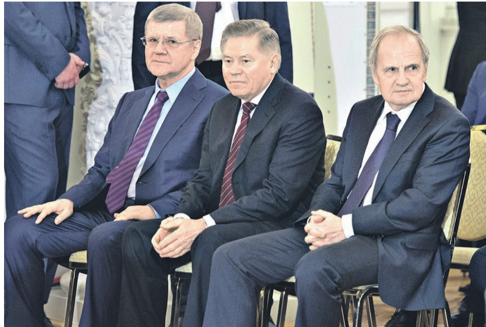
Генпрокурор Юрий Чайка (слева) пытался держаться незаметно. Но когда президент говорил о коррупции, телеоператор зачем-то навел на него камеру, вызвав смех и аплодисменты в пресс-центре. На фото — с председателями Верховного суда Вячеславом Лебедевым и Конституционного суда Валерием Зорькиным (слева направо)