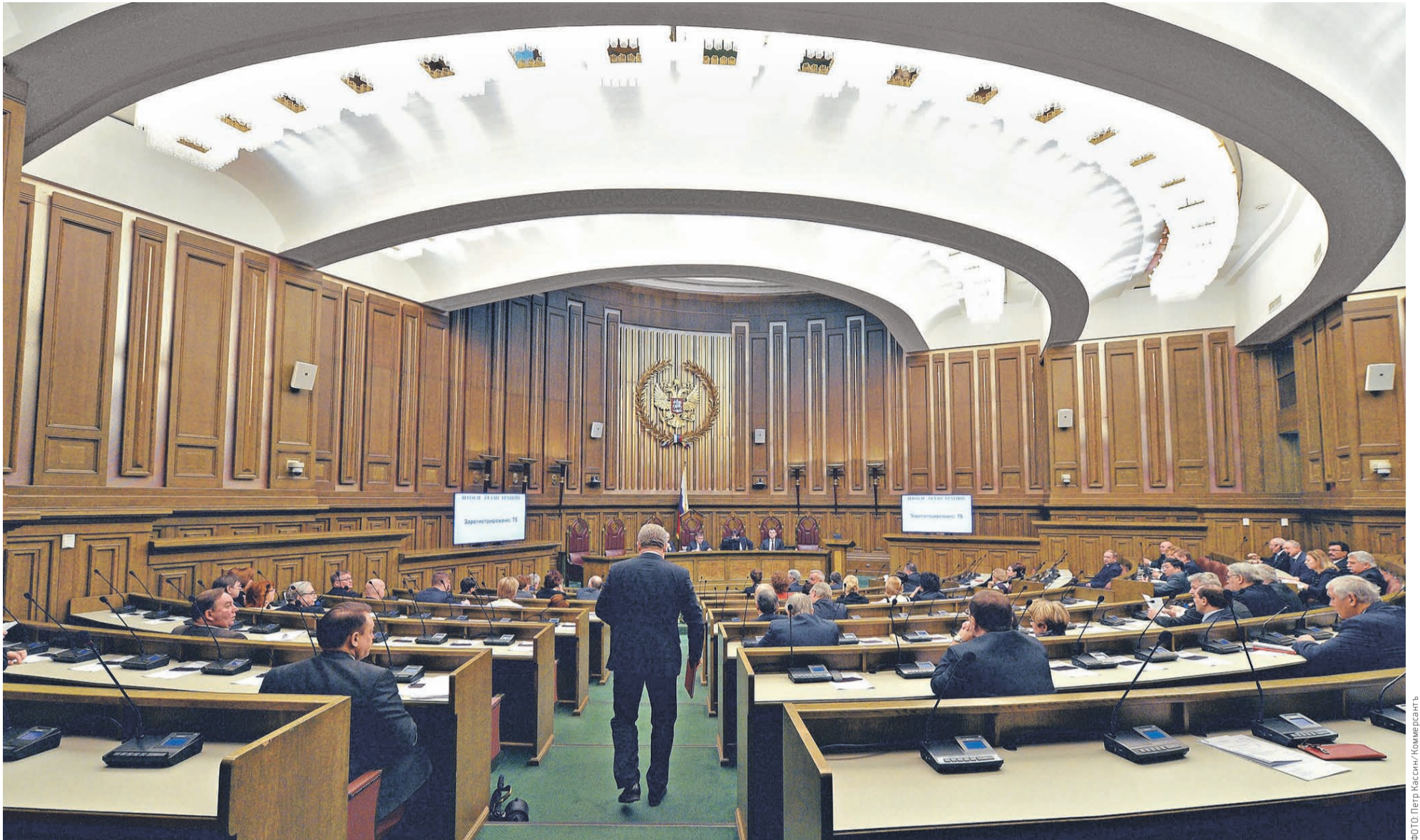
Инициатором декриминализации стал Верховный суд — в июле на пленуме ВС (на фото) был разработан законопроект с соответствующими поправками в УК и УПК

Владимир Путин за декриминализацию мелких преступлений и сокращение числа присяжных