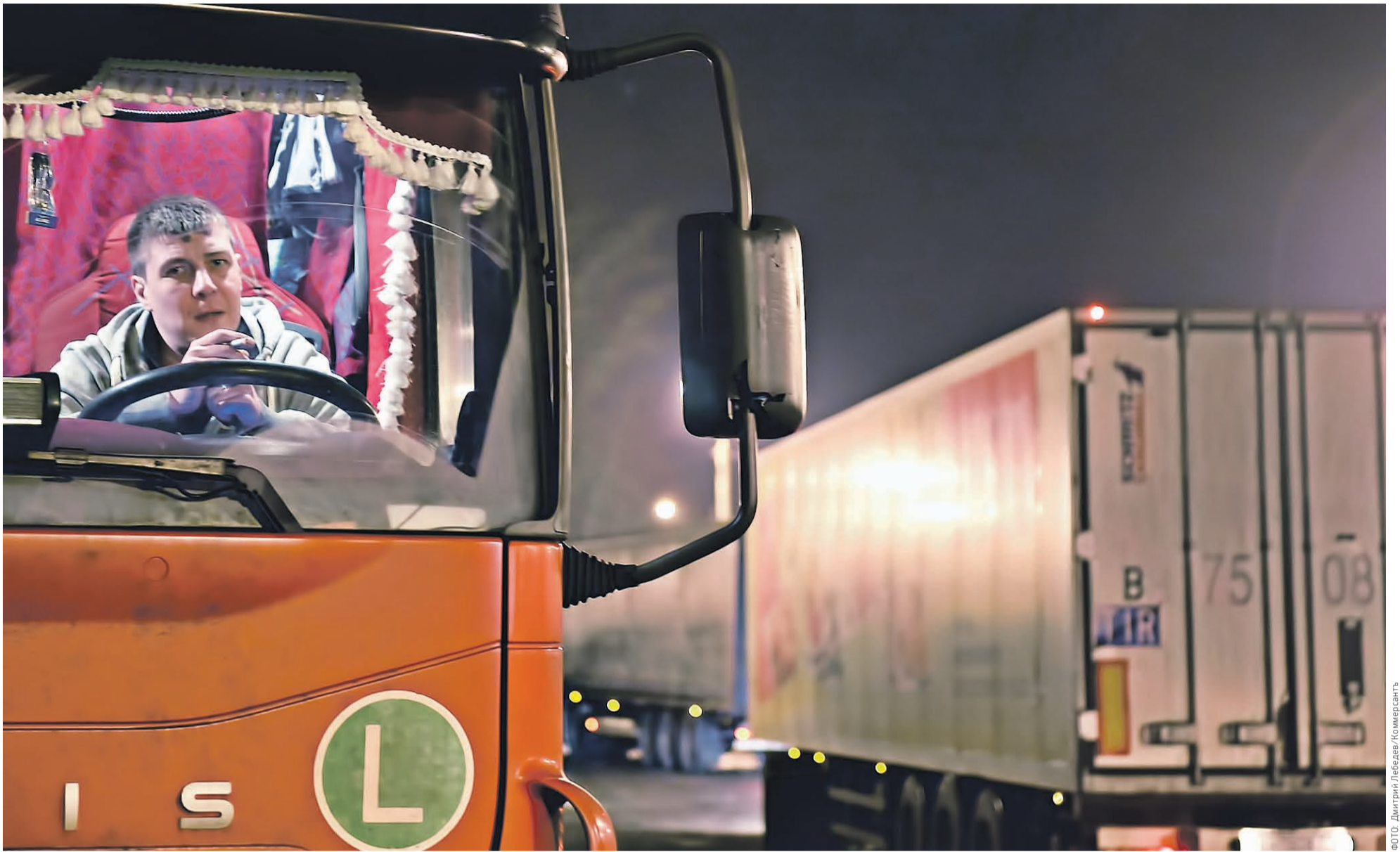
Передел рынка из-за «Платона» может привести к исчезновению мелких перевозчиков