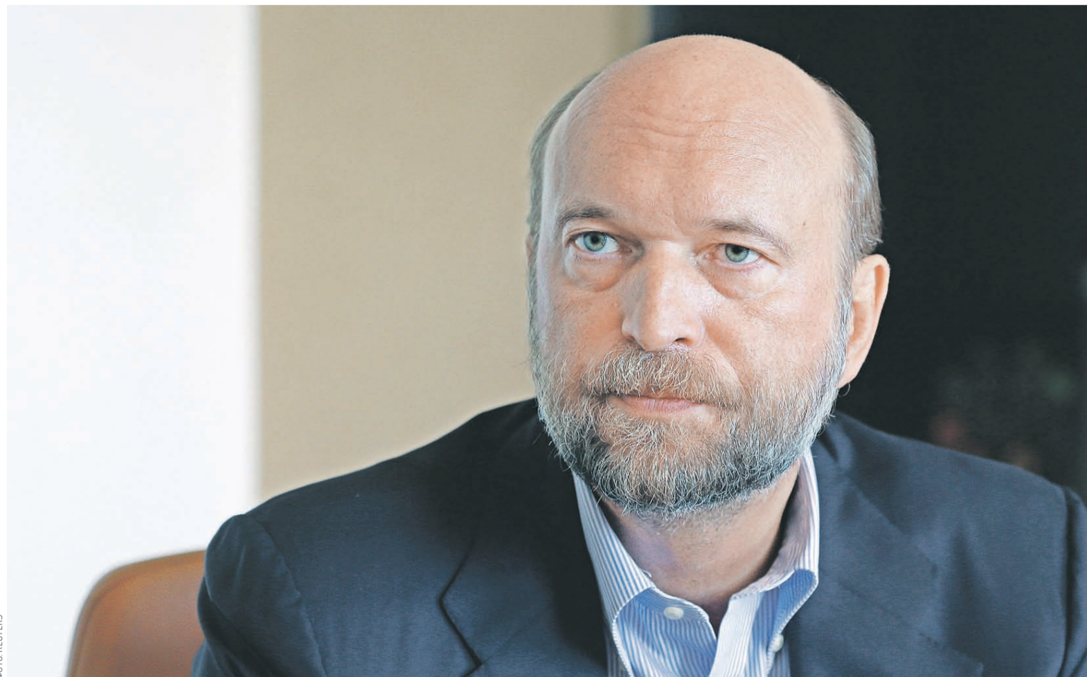
Если Высокий суд справедливости Англии и Уэльса признает Сергея Пугачева виновным, бывшему сенатору грозит до двух лет лишения свободы

В конце июня 2015 года Пугачев перебрался из Великобритании во Францию в нарушение приказа лондонского суда, согласно которому ему было запрещено покидать пределы юрисдикции, а все его паспорта