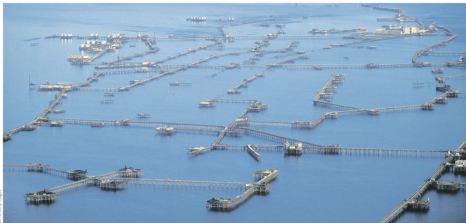
Несмотря на все усилия Саудовской Аравии, мировая добыча нефти в последние годы только растет (на фото — азербайджанские буровые установки в Каспийском море)

«Чтобы сократить добычу, необходимо участие стран, не входящих в организацию, а также Ирака», — сказал Financial Times (FT) один из делегатов ОПЕК. — Ситуация с добычей в Иране также должна быть ясна». Багдад, например, может получить предложение воздержаться от увели-