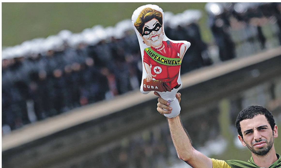
Рейтинг поддержки Руссефф всего через год после переизбрания на второй срок не превышает 10% (на фото — протест против Руссефф у здания Национального конгресса Бразилии)

На известия о начале процедуры импичмента Руссефф отреагировала резко. «Я с возмущением узнала о решении председателя палаты депутатов дать ход требованию