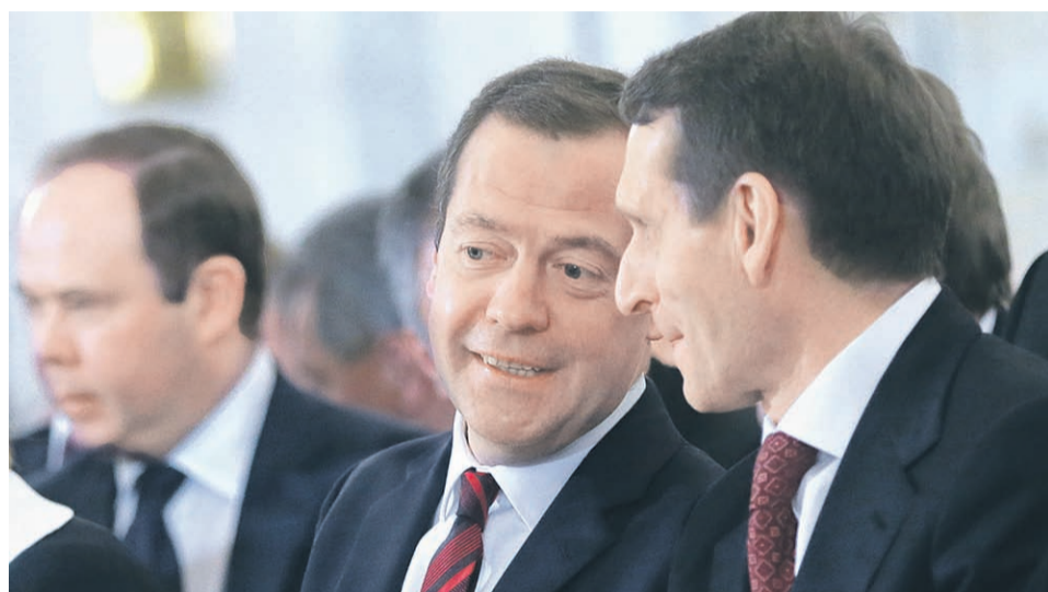
Премьера Дмитрия Медведева президент в послании похвалил: «Знаю, что председатель правительства уделял этому [детским садам] особое, личное внимание. Спасибо, Дмитрий Анатольевич». На фото — со спикером Госдумы Сергеем Нарышкиным

дело масштабным. Основным же новшеством было создание «объединенных» инспекций на региональном или муниципальном уровне, которые проверяли бы только определенный круг небольших предприятий.