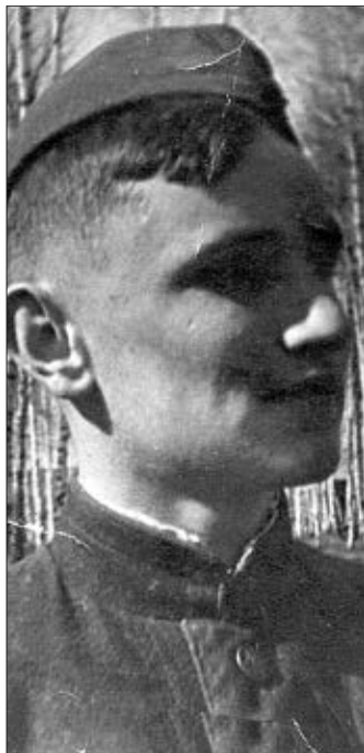
Эфраим Севела. Весна 1945 года.