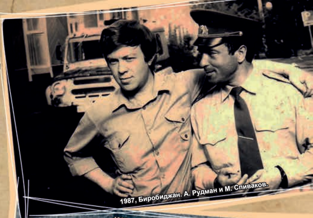
1987, Биробиджан. А. Рудман и М. Спиваков.